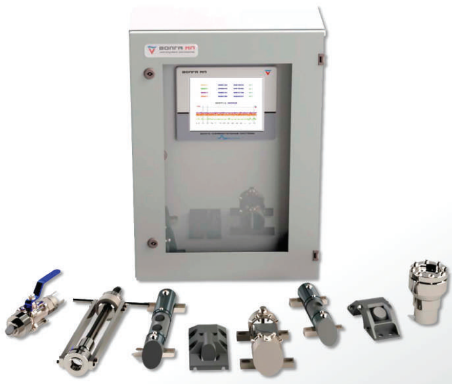
Рис. 1. Расходомер «Волга МЛ»: набор первичных преобразователей для разных применений и вторичный преобразователь

Кроме этого, цифровая платформа дает возможность использовать расходомер в системах предиктивного анализа различных ГТС, гидротурбин ГЭС, конденсаторов ТЭС и АЭС. Создание цифровых двойников узлов и агрегатов системы, а также